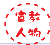
馬丁·尼莫拉 (Martin Niemöller)