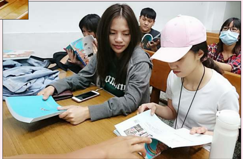
(高雄原住民大專學生中心-娜魯灣團契)