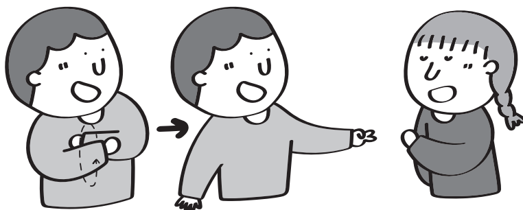
他拯救了我：雙手握拳繞圈，唸到「我」時和對手猜拳