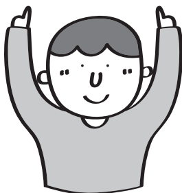
上主：雙手食指向上指天