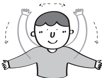
堅強的：雙手向上攤開畫大圈